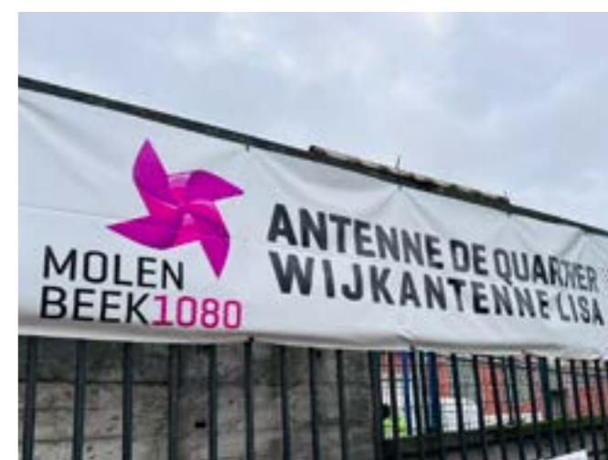
Inauguration de LISA Molenbeek