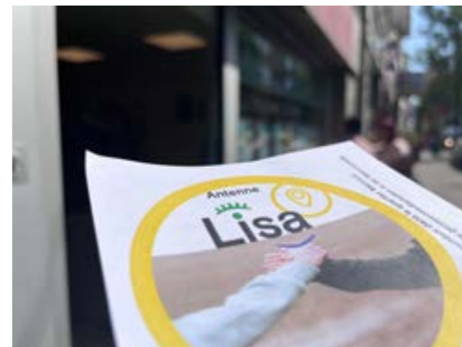
Inauguration de LISA Forest

Grâce à l'appel à projets annuel pour les asbl, safe.brussels soutient également la réalisation de plusieurs projets inscrits dans une mesure du Plan global de Sécurité et de Prévention. Pour l'appel à projets 2021, safe.brussels a soutenu un total de 54 projets de différentes asbl telles que Atmosphères Amo, JES ou encore CIDJ & Inforjeunes, dont les projets visent à améliorer le dialogue (sur les droits et les devoirs) et l'interaction entre la police et les jeunes.