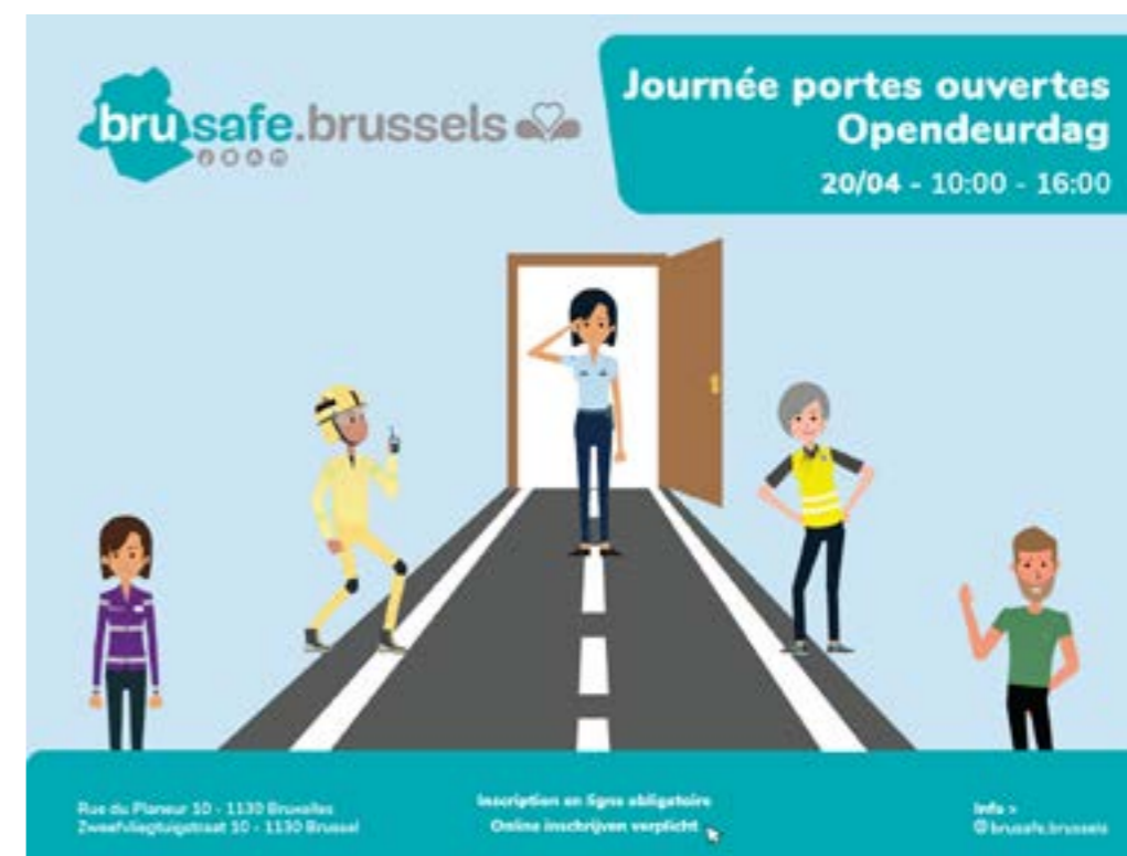
Journée portes ouvertes Brusafe

Par ailleurs, la Cité des métiers organise régulièrement pour les élèves du secondaire des activités d'orientation auxquelles le COR est invité pour présenter les métiers du secteur.