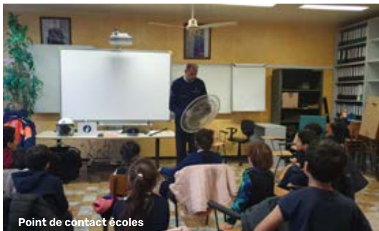
Point de contact écoles